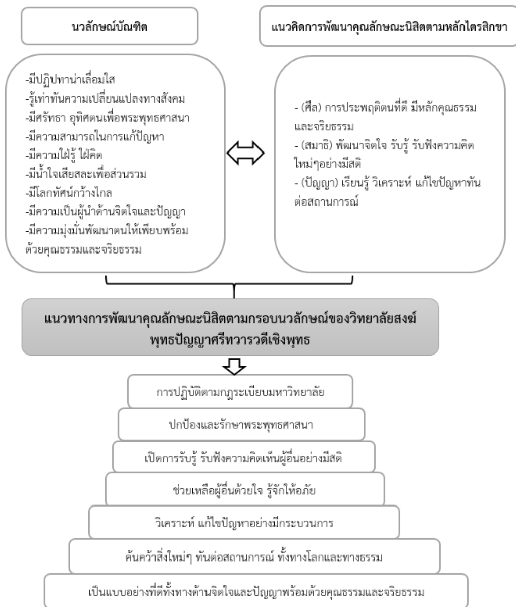
แผนภาพที่ 1 องค์ความรู้จากการวิจัย